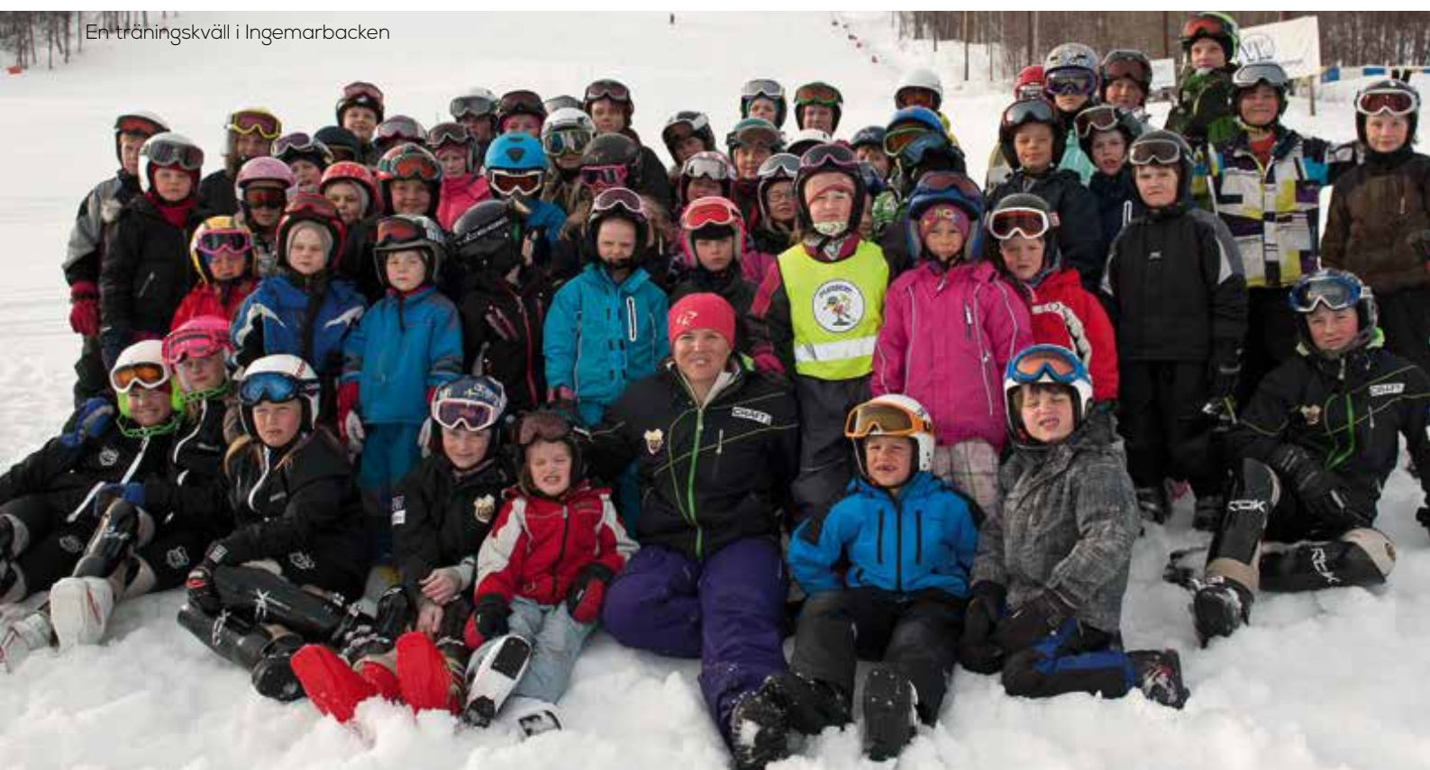
En träningskväll i Ingemarbacken