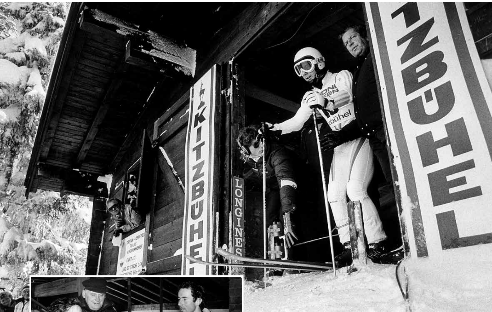
Ingemar Stenmark på start i det klassiska störtloppet Hahnenkammrennen i Kitzbühel