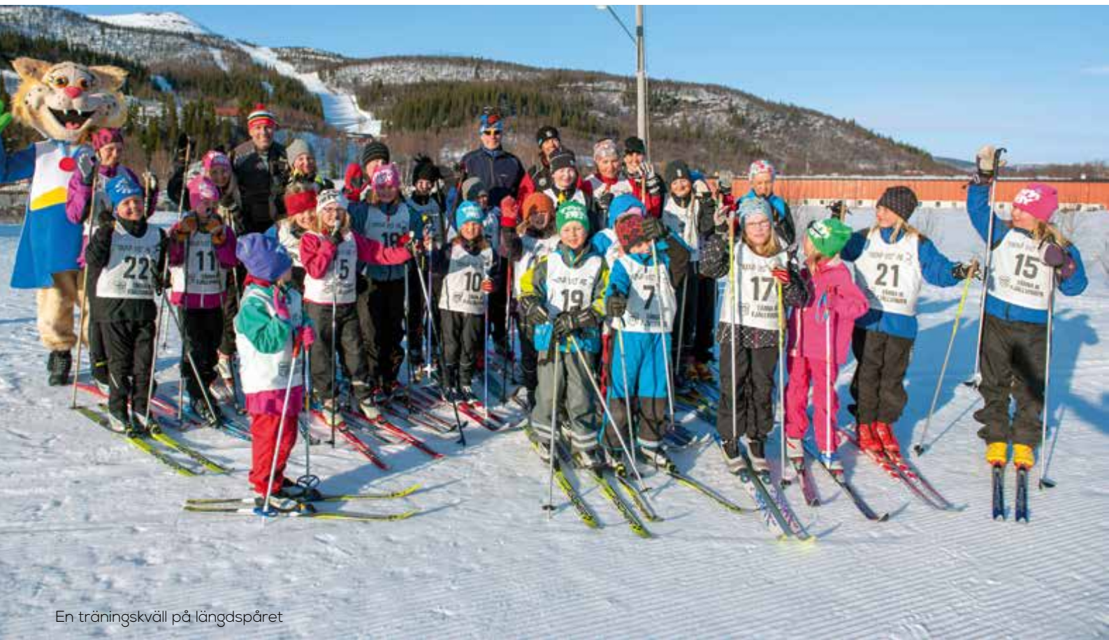
En träningskväll på längdspåret