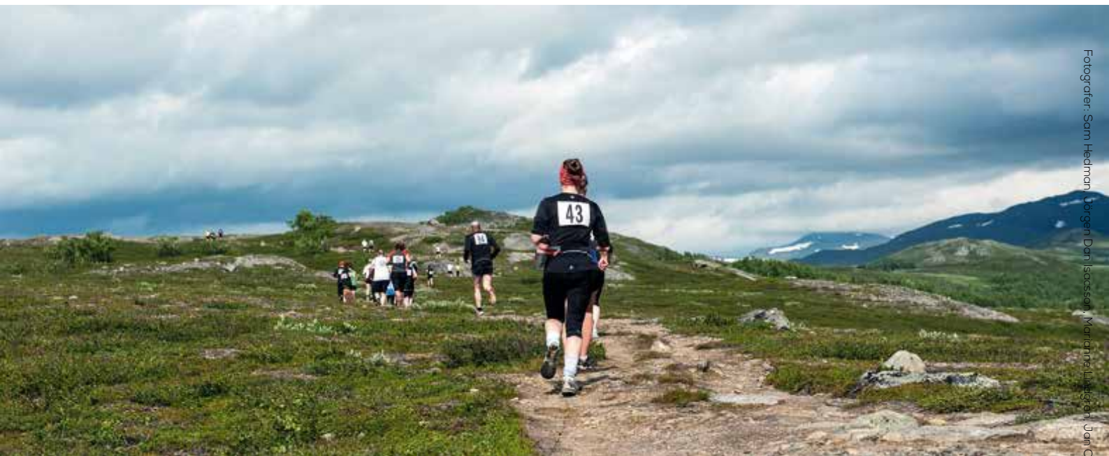
Fjällvindenterrängen på Drottningleden mellan Laisaliden och Hemavan