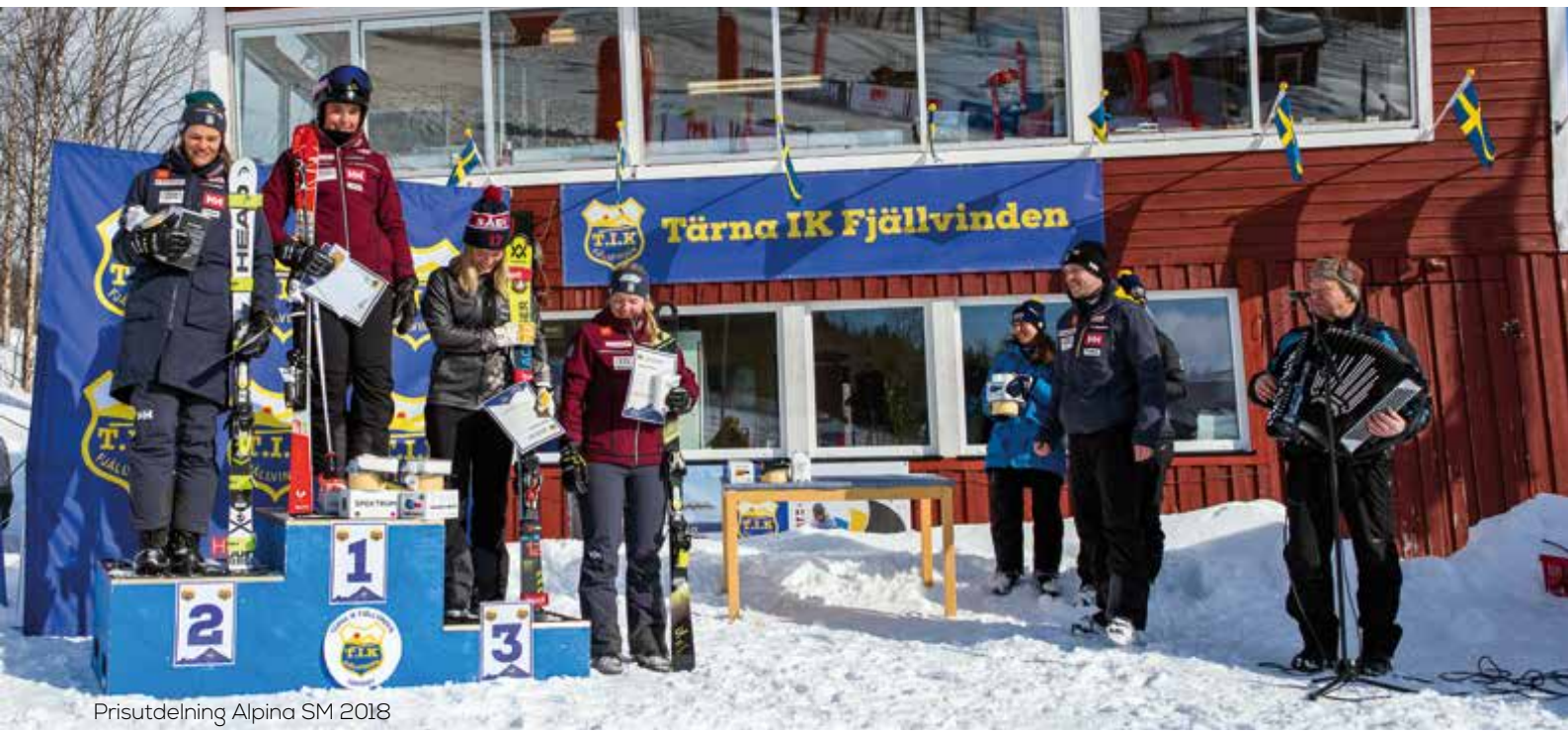
Prisutdelning Alpina SM 2018