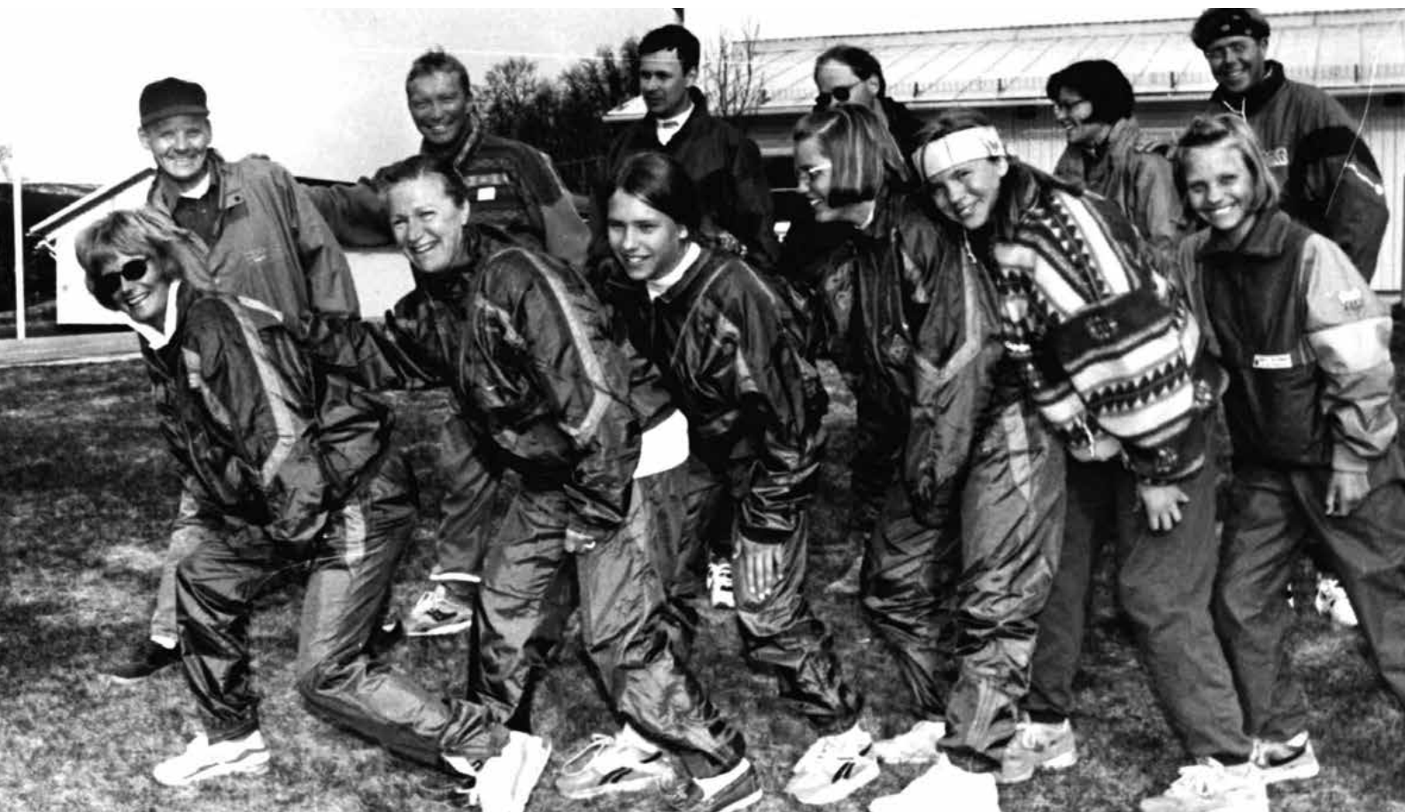
Ett av Fjällvindens lag i Vindelälvsloppet