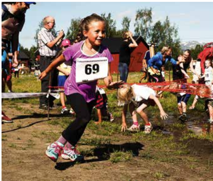
Fjällvinden Tough Kidz

Orientering har aldrig haft någon sektion men mid-sommarmhelgen 1973 stod Fjällvinden som arrangör av två stora orienteringstävlingar med 270 startande i varje tävling.